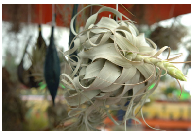
Particolare di una pianta aerea esposta al Mercato Verde

L'impegno profuso dalla Fondazione Carima nel 2005, quindi, è stato fortemente ripagato dall'esito positivo della manifestazione e al tempo stesso dalla consapevolezza che il messaggio veicolato è stato colto e fatto proprio da una vasta platea, segno che i temi proposti stanno a cuore alla collettività locale e sono di indiscussa attualità.