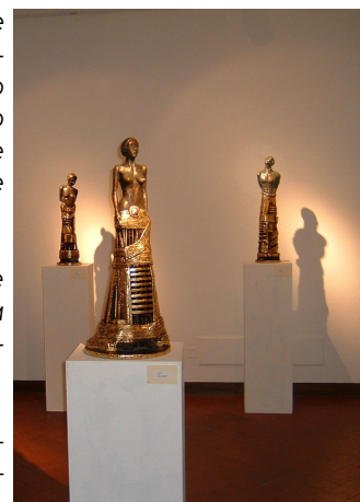
Una sala della mostra

Con la loro abilità nel forgiare la materia, unita all'instancabile impegno profuso nella ricerca, sono stati altresì "messaggeri" dell'arte marchigiana, ed in particolare maceratese, sul territorio nazionale.