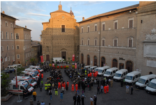
Panoramica dall'alto di Piazza della Libertà

La Fondazione Carima, infatti, ha messo a disposizione del proprio territorio di riferimento, e quindi di tutte le persone che ad esso appartengono, un pacchetto di circa trenta veicoli per un valore che si aggira intorno al milione e mezzo di euro.