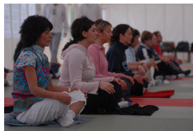
Un momento del corso di Yoga