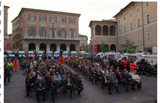
I numerosi presenti alla manifestazione

Fa piacere ricordare anche che l'unica beneficiaria di questa importante operazione è stata la collettività locale, rappresentata sia dagli operatori, che possono ora svolgere più efficacemente ed efficientemente il proprio lavoro, sia