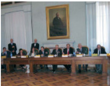
Sottoscrizione dell'atto costitutivo

È nato, su iniziativa delle Fondazioni bancarie e del mondo del Volontariato, un nuovo soggetto che si propone di promuovere e potenziare l'infrastrutturazione sociale del Mezzogiorno. Attraverso l'attuazione di forme di collaborazione e di sinergia con le diverse espressioni delle realtà locali, la Fondazione per il Sud favorirà, in un contesto di sussidiarietà e di responsabilità sociale, lo sviluppo di reti di solidarietà nelle comunità locali. Ciò avverrà rafforzando e integrando le reti del volontariato, del terzo settore e delle fondazioni, con strumenti e forme innovative che, senza sostituirsi al necessario ruolo delle istituzioni pubbliche, operino in sinergico rapporto con esse, per contribuire alla costruzione del bene comune e alla realizzazione dell'interesse generale.